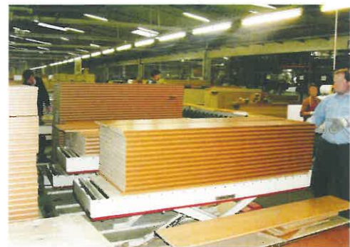
Da die Transportplatten in unterschiedlichen Längen verwendet werden, wurden 1.400 mm und 2.200 mm lange Hubtische gebaut.

Es war ein Kundenwunsch, der es in sich hatte: 200 mm Bauhöhe bis Oberkante Tragrolle – das war die Kernforderung an Hubtische mit Rollenbahn, die ein bekannter Hersteller von Mitnahmemöbeln für seine Fertigung suchte. Denn 200 mm beträgt die