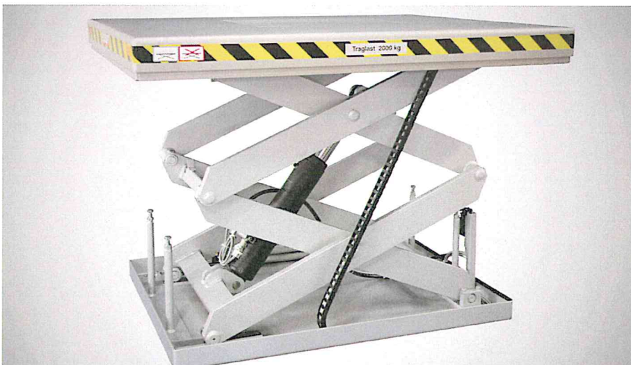
2 TONNEN HUBTISCH VON FLEXLIFT.